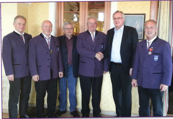
13.04.2013 - Generalversammlung mit Neuwahlen