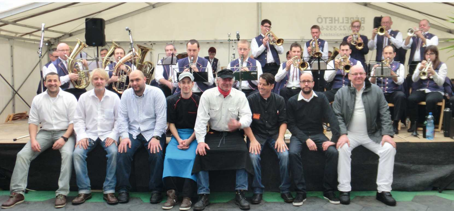
24.11.2013 - Kirtag