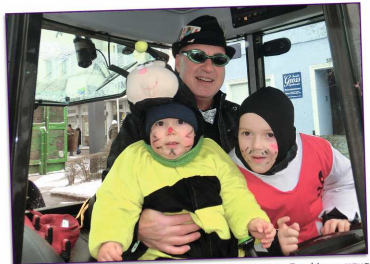
10.02.2013 - Faschingsumzug