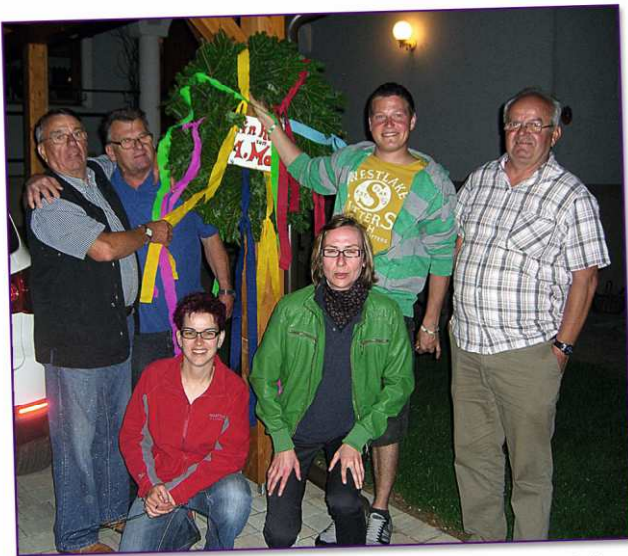
30.04.2013 - Maikränze