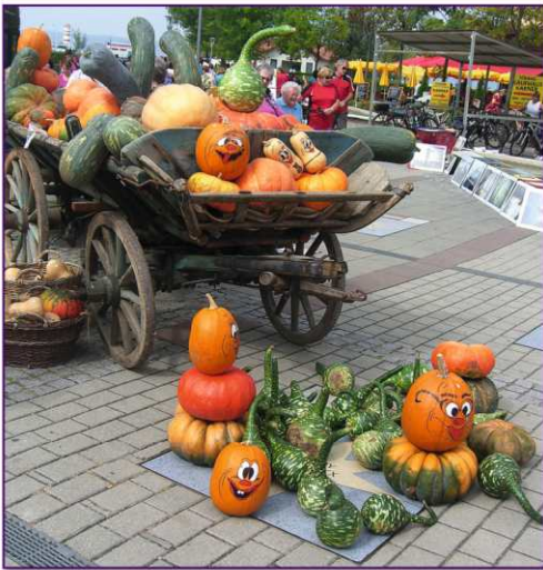
29.09.2013 - Kürbisfest