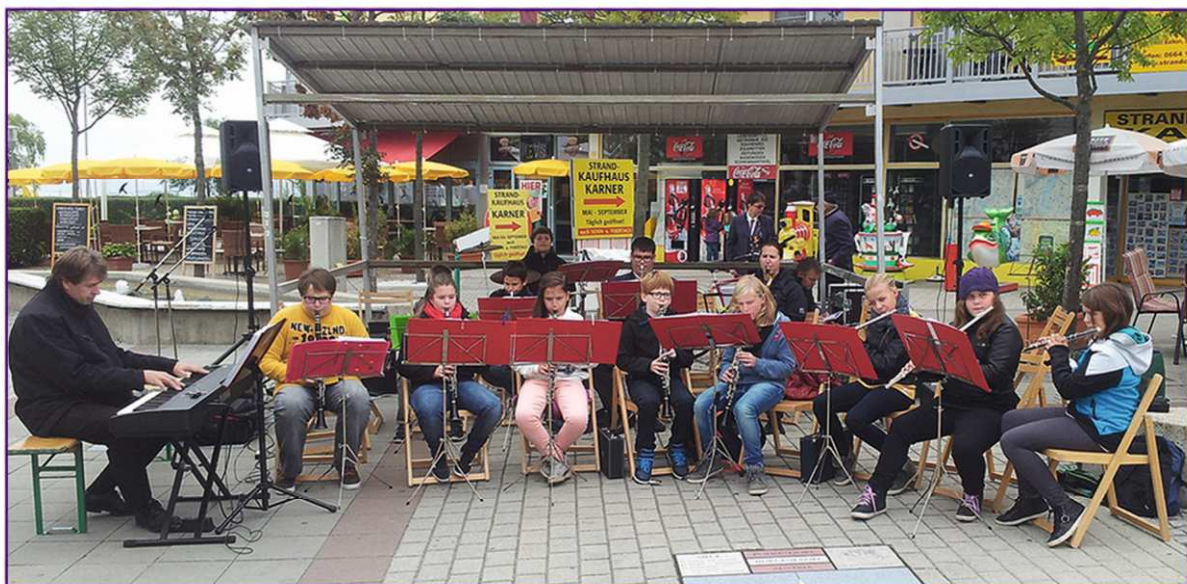
29.09.2013 - Kürbisfest

Allen sei an dieser Stelle für die sehr gute Zusammenarbeit herzlichst gedankt.