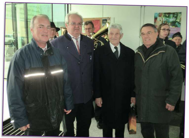
24.03.2013 - 90er „Lenzonkel“