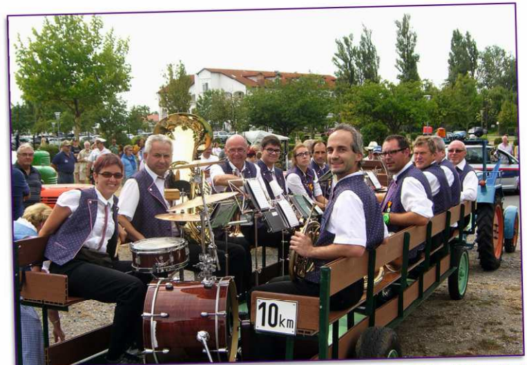
10.08.2013 - Mühlenfest