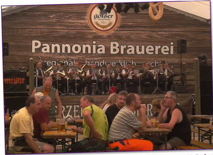
15.08.2013 - Golser Volksfest